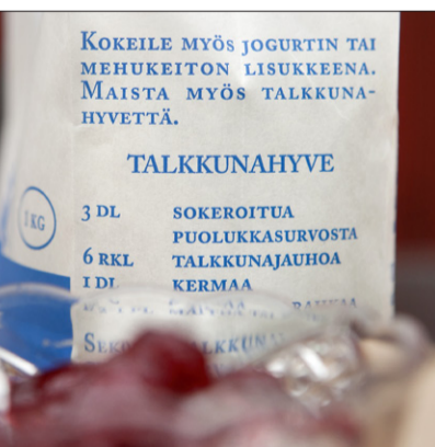
Talkkunajauhosta saa myös hyvettä.