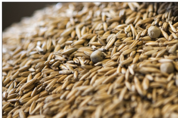
Ussan talkkunassa on kauraa ja mausteena hernettä.