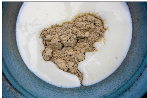
Piimä ja talkkuna. Se perinteinen yhdistelmä.